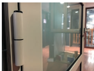
ZOOM SUR PAUMELLES A CLAMER GAMME LOURDE