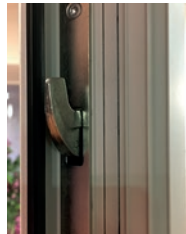
ZOOM SUR CROCHETS