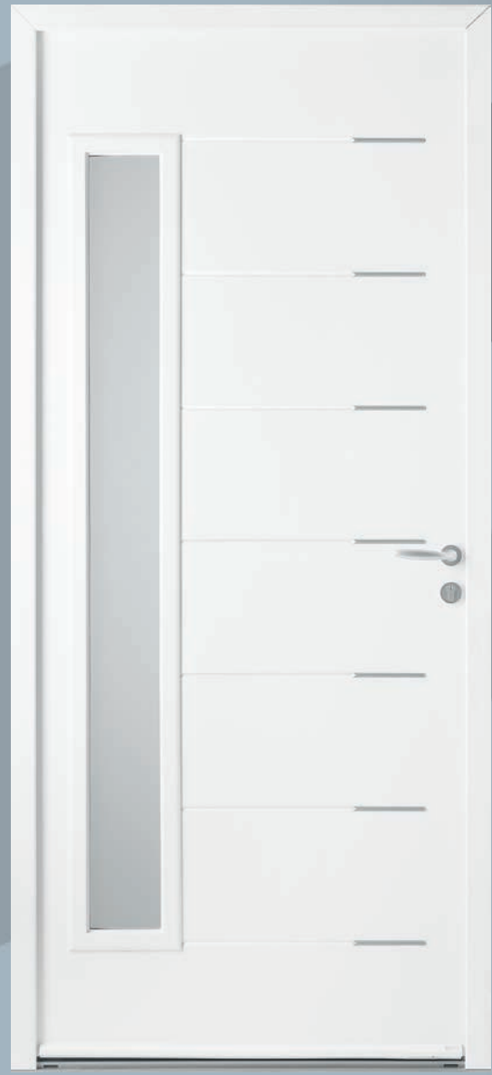
FEEL (RAL 9016 en situation)