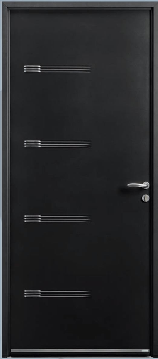
TOUCH (RAL 2100 en situation)