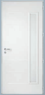
FEEL vue intérieure