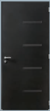
TOUCH vue intérieure