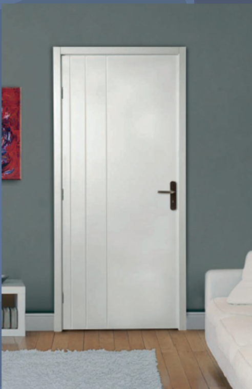
GRAV 160 - RAINURES VERTICALES