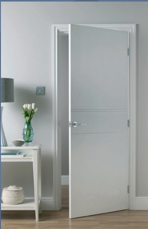
GRAV 170 - RAINURES HORIZONTALES