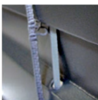
Ruban de traction en térylène Ruban porteurs armés de kevlar