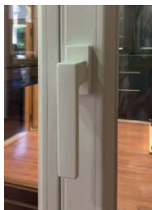
Poignée en option TOULON