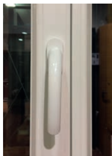
Poignée en base